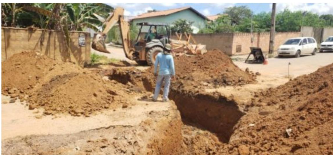
Drenagem da Corinto começou pela Rua Araçuaí

Em seguida, famílias que vivem nesta rua ganharão asfalto novo e durável.