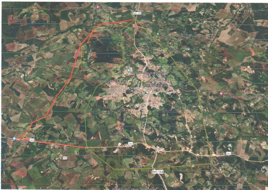
Imagem 2 – área de expansão urbana proposta pelo Município