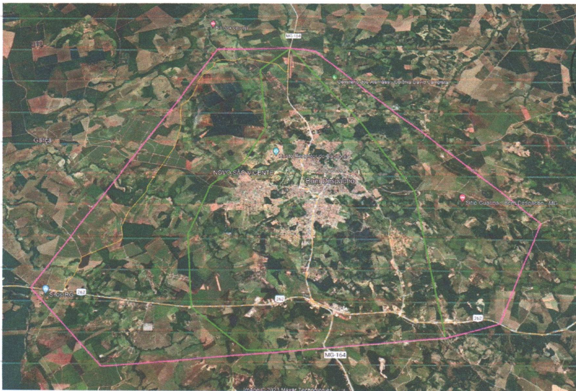
Imagem 1 – área de expansão urbana proposta pela Vereadora

CÂMARA MUNICIPAL DE BOM DESPACHO Fls 24 A CASA DO CIDADÃO